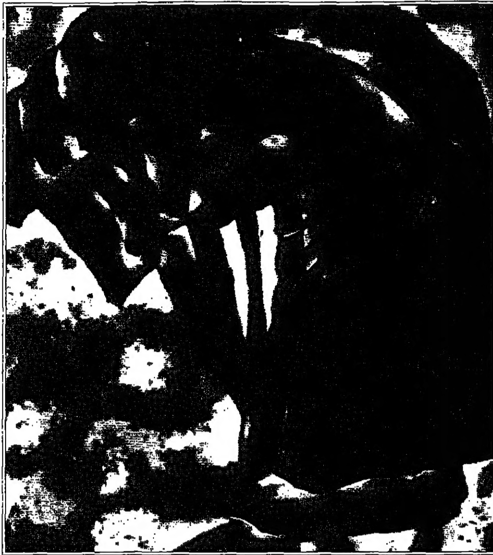
من أعمال الفنان مارجو سوكاتمو